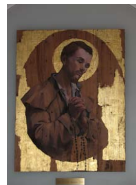
Chapelle de la Petite Famille de l'Exode