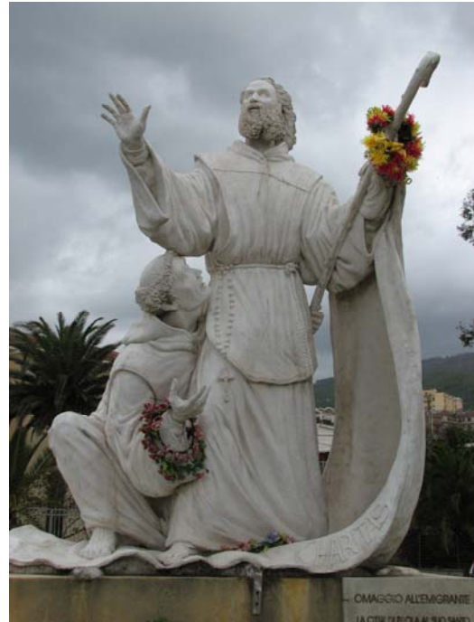
Statue de St François de Paule (1370-1465)

dans la ville de Paola. Les phénomènes surnaturels attribués à Francesco ne manquent pas, notamment la traversée du détroit de Messine sur son manteau étendu, après que le patron de barque lui ai refusé de le faire passer avec quelques disciples.