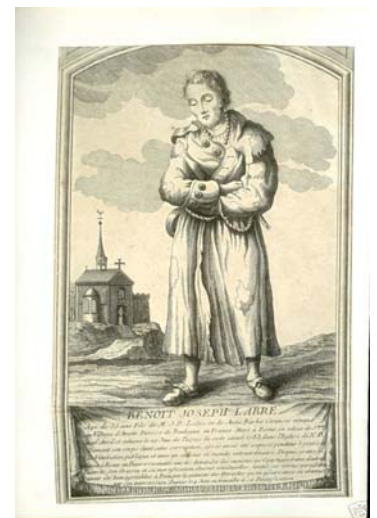
Estampe du XVIIIe s.

Francis DOMONT Fait à la Grande Trappe de Soligny – 28 mai 2004