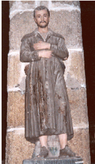
Eglise paroissiale de Guimaëc, Finistère nord